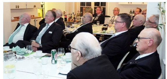
Bröderna lyssnade andäktigt...

Vad titeln syftar på är att det inte var Romarna som uppfann vinet utan detta låg mycket längre tillbaka i tiden, så långt som 3-4000 år före Romarrikets uppkomst. Från ca 2000 f Kr hade folken i och kring Greklands övärld utvecklat en vinodlingskultur som inte ens en barbarinvasion från norr 1200-1100 f Kr kunde ta kål på, även om det mesta lades i mörker, även skriftspråket.